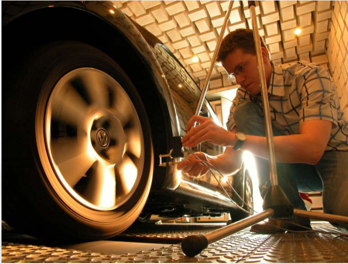
Großes Schallmesshaus (Halbfreifeldraum) mit integriertem Rollenprüfstand